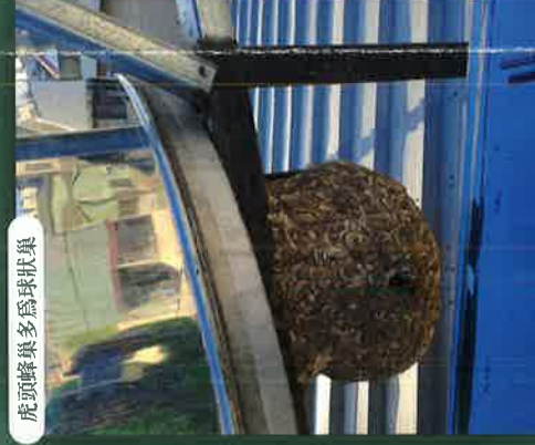
虎頭蜂巢多為球狀巢

危險度最高，民眾最害怕的類群，其會於每年4-5月開始築巢，工蜂會捕捉大量昆蟲來育幼，工蜂本身則食用一些花蜜、樹液。每年9月工蜂數量最多，巢內壅擠，且會開始產出新蜂王，故會較具攻擊性。