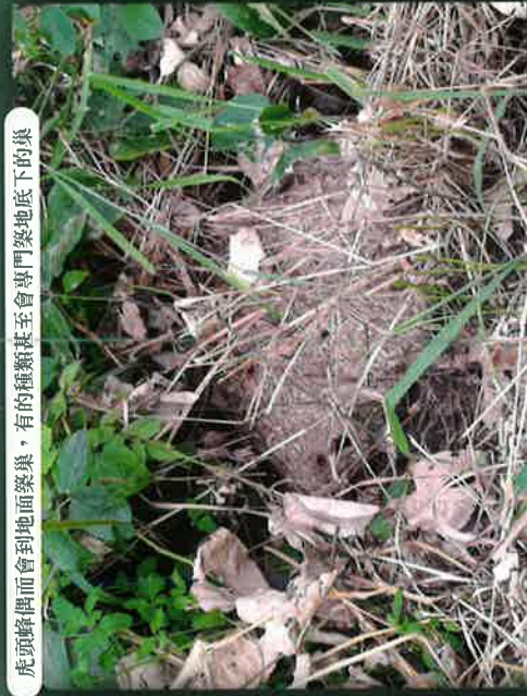
虎頭蜂偶會到地面築巢，有的種類甚至會專門築地底下的巢