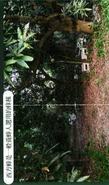
西方蜂是一般養蜂人選用的蜂種