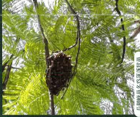
長腳蜂巢多為蓮蓬狀巢